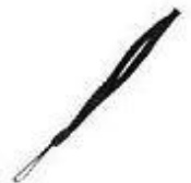
提繩 Hand Strap