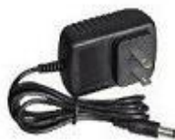
電源變壓器 Power Adapter